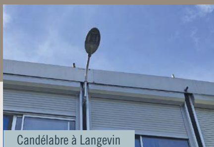
Candélabre à Langevin