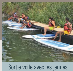
Sortie voile avec les jeunes