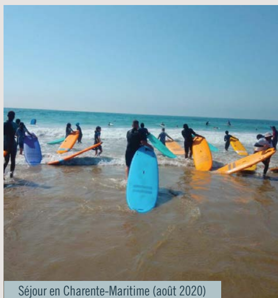
Séjour en Charente-Maritime (août 2020)