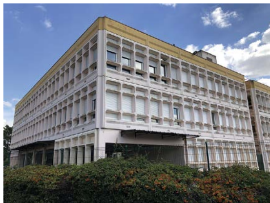
Le collège Charles-Péguy à Bondoufle.

Île-de-France Mobilités a mis en place une solution de transport adéquat dès cette rentrée. Le transporteur TICE assure une liaison directe, la ligne 413 F, qui permet aux collégiens concernés de se rendre directement au collège Charles-Péguy à Bondoufle. Les arrêts (du lundi au vendredi) sont les suivants : Résidences (8h02), Rond-point de Fleury (8h05), Mairie (8h06), Hôpital Manhès (8h07), ZI des Ciroliers (8h09), arrivée à Bondoufle rue des Clos (8h15).