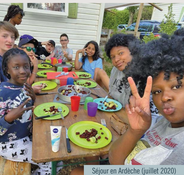
Séjour en Ardèche (juillet 2020)