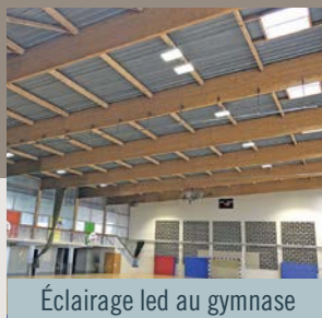
Éclairage led au gymnase