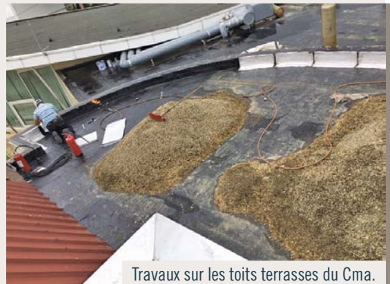
Travaux sur les toits terrasses du Cma.

► Divers travaux dans les écoles et les crèches : pose de films occultants ou de stores, petites réparations d'électricité et d'éclairage, aménagements... (régie municipale), etc.