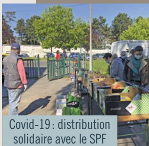
Covid-19 : distribution solidaire avec le SPF