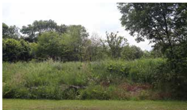
Aujourd'hui, un talus de 1,50 mètre témoigne de l'important apport de gravats.