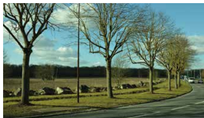
En 2016, le terrain des 7 hectares se situe au même niveau que la rue Roger-Clavier.