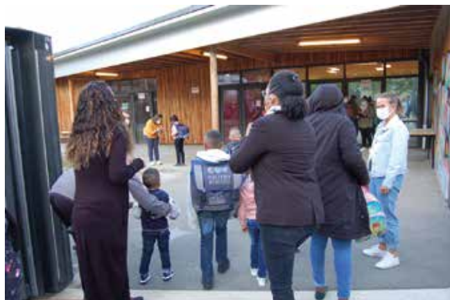
La rentrée 2020 à l'école Robert-Desnos.

Le quotient familial est calculé en fonction des revenus et de la composition de chaque foyer. Il est nécessaire pour établir des tarifs personnalisés selon votre situation pour les différentes activités comme la cantine, l'accueil périscolaire, l'étude après l'école ou les centres de loisirs. Présentez-vous en mairie, obligatoirement avant le 31 août 2021 et muni de votre situation déclarative de 2020 ou votre attestation RSA. Vous pouvez égale-